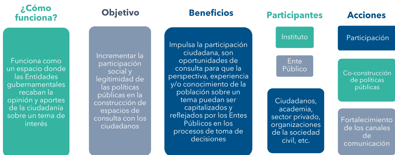
Esquema general sobre Consulta Pública.