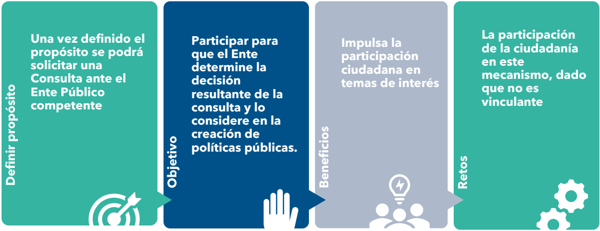
Esquema sobre Consultas Públicas y el Ciudadano.